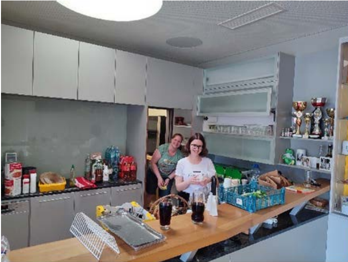
Frühjahrsputz im MusiHaus – muss auch mal sein...

Bei uns war in den letzten Monaten tatsächlich viel los – aber bei all den Spielereien, Feiern und auch viel Arbeit durfte der Spaß nicht fehlen, und der ist bei uns immer wieder im Programm mit dabei!