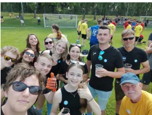
7-Meter-Turnier beim SVZ

Der Musikverein Zillingdorf Eggendorf wünscht einen schönen Sommer & freut sich schon sehr, wenn wir uns zum Beispiel am 2.9.2023 ab 19 Uhr zum MusiPicknick am Seeplatz Bruch I sehen!