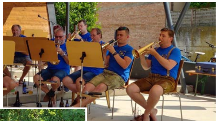
Seit langem wieder ein eigener Frühschoppen beim Haus der Musik