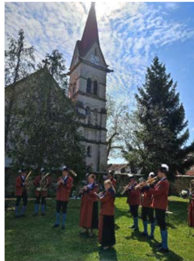
Erstkommunion bei strahlendem Sonnenschein...

Der Musikverein Zillingdorf Eggendorf wünscht einen schönen Sommer & freut sich schon sehr, wenn wir uns zum Beispiel am 2.9.2023 ab 19 Uhr zum MusiPicknick am Seeplatz Bruch I sehen!