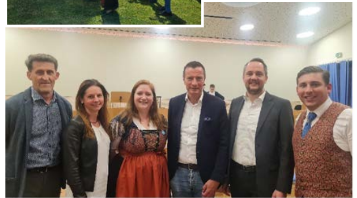
Frühlingskonzert zugunsten von „Licht ins Dunkel“